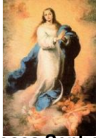
Nossa Senhora Conceição