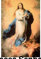
Nossa Senhora Conceição