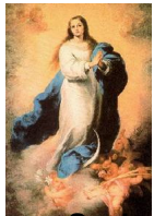
Nossa Senhora Conceição