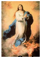
Nossa Senhora Conceição