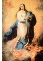
Nossa Senhora Conceição