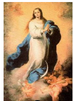
Nossa Senhora Conceição