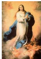
Nossa Senhora Conceição