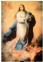
Nossa Senhora Conceição