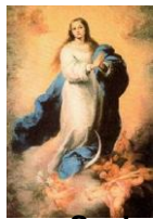
Nossa Senhora Conceição