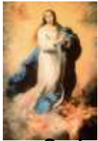
Nossa Senhora Conceição