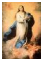
Nossa Senhora Conceição