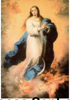
Nossa Senhora Conceição