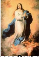
Nossa Senhora Conceição