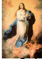
Nossa Senhora Conceição