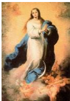
Nossa Senhora Conceição