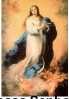
Nossa Senhora Conceição