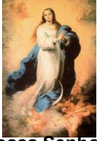
Nossa Senhora Conceição