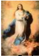
Nossa Senhora Conceição