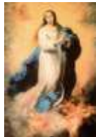
Nossa Senhora Conceição